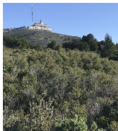
▲ Le sommet du massif de l'Étoile, vu du site de la plantation.

LE REBOISEMENT DOIT PERMETTRE DE RESTAURER LE PAYSAGE TRADITIONNEL EN IMPLANTANT DES ESPÈCES LOCALES : CHÊNES VERTS, FRÊNES À FLEURS ET PINS D'ALEP POUR LES ARBRES ; CADES, FILAIRES, ARBOUSIERS POUR LES BUISSONS.