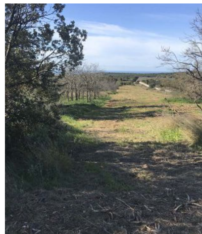
▲ La friche urbaine à replanter.