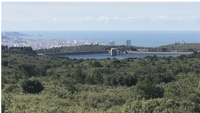
▲ La rade de Marseille et la retenue d'eau, vues du site de la plantation.