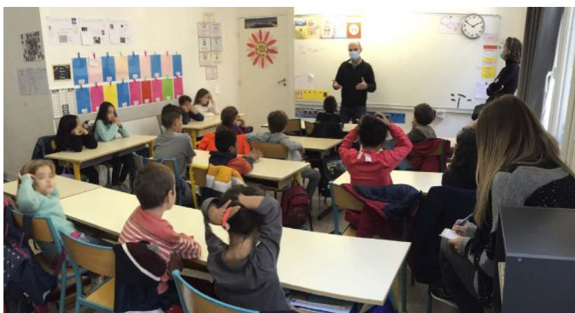
▲ Intervention devant les élèves de CE 1 / CE 2 du Sacré-Cœur (Marseille, 1 er arrondissement).