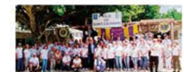
A quelle association sera affectée la somme récoltée ?