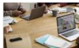
Gestion du Club