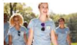
Rapport d'Activité de Club