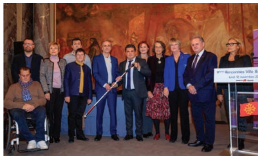
Remise de la 150° canne

Siège Social : 12, rue de l'Etoile – 31000 TOULOUSE