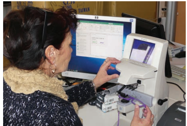
Atelier d'optique du Havre Vérification des verres de lunettes, avant expédition