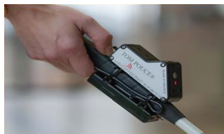
Tom Pouce III® (TP3®)